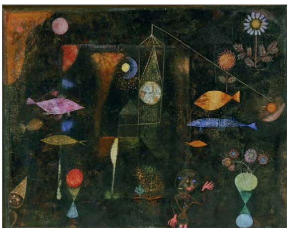
Paul Klee «Fish Magic» Paul Klee «Maagiline kala» Пауль Клее «Магия рыб»