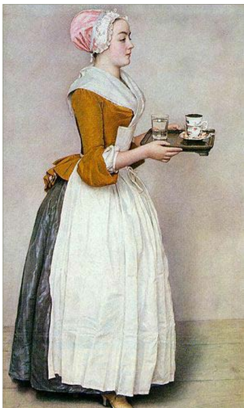
Jean-Étienne Liotard «The chocolate girl»