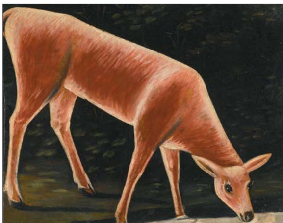
Niko Pirosmani «Roe deer by a creek»