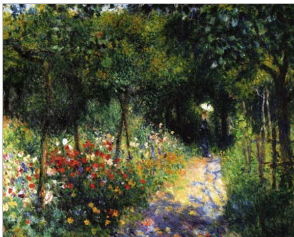
Pierre-Auguste Renoir «Woman at the garden»