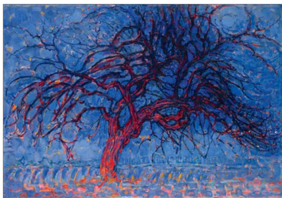
Piet Mondrian «The red tree» Pit Mondrian «Punane puu» Пит Мондриан «Красное дерево»