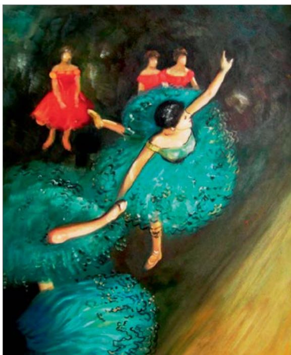
Edgar Degas «The green dancer» Edgar Degas «Tantsija rohelistes» Эдгар Дега «Танцовщица в зеленом»