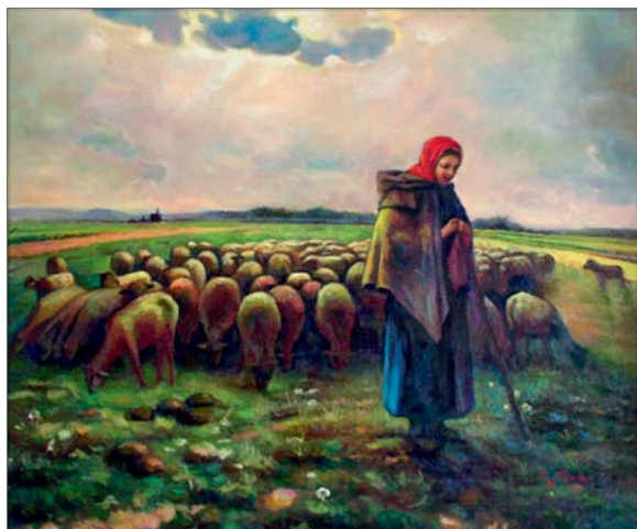
Jean-Francois Millet «Shepherdess and her flock»