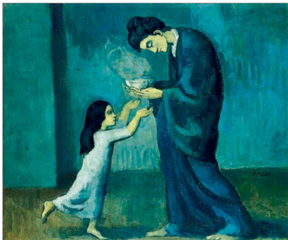
Pablo Picasso «Soup»