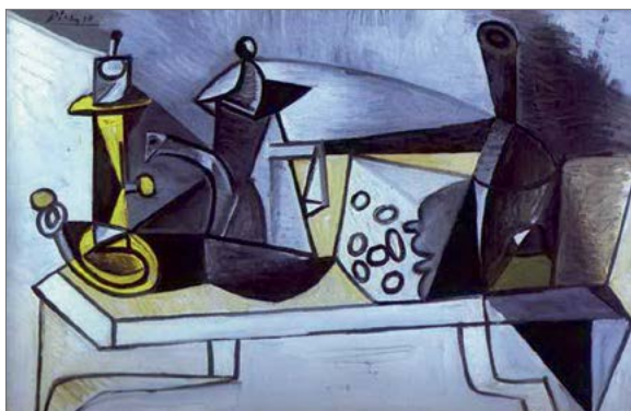
Pablo Picasso «Still life with cheese» Pablo Picasso «Vaikelu juustuga» Пабло Пикассо «Натюрморт с сыром»