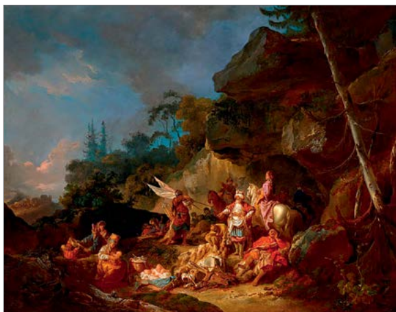
Jean-Baptiste Le Prince «The tartar camp» Jean-Baptiste Le Prince «Tatarlaste laager» Жан-Батист Лепренс «Татарский лагерь»