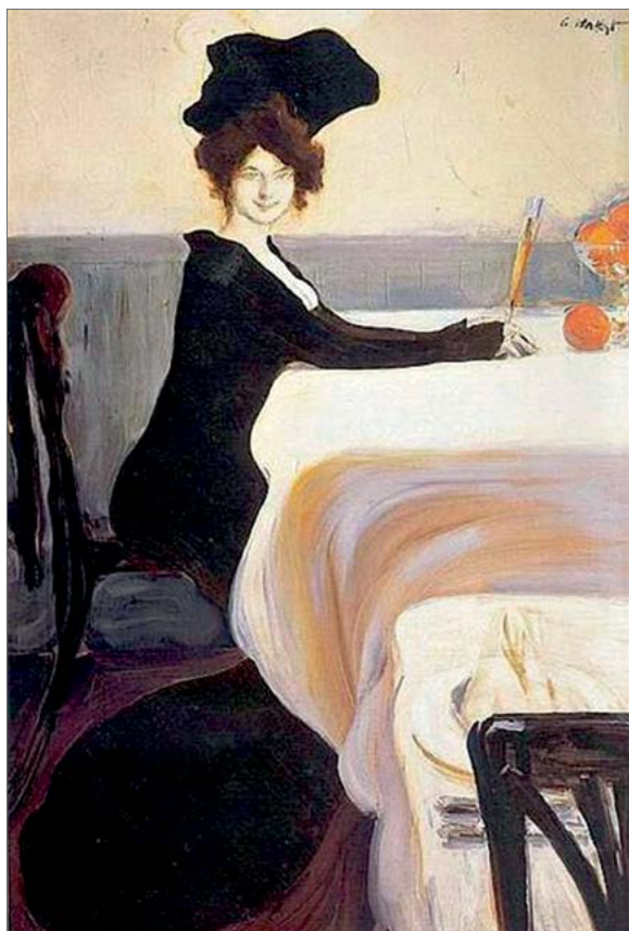
Leon Bakst «Supper»