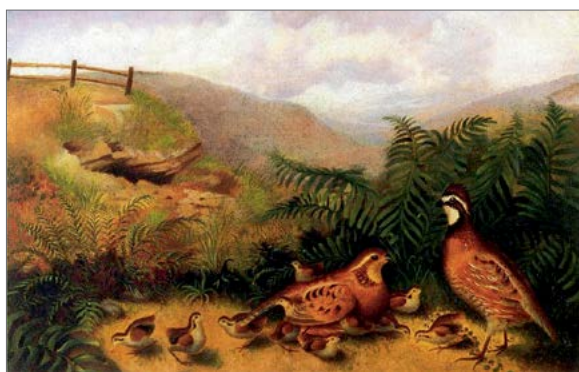
Rubens Peale «Landscape with quail»