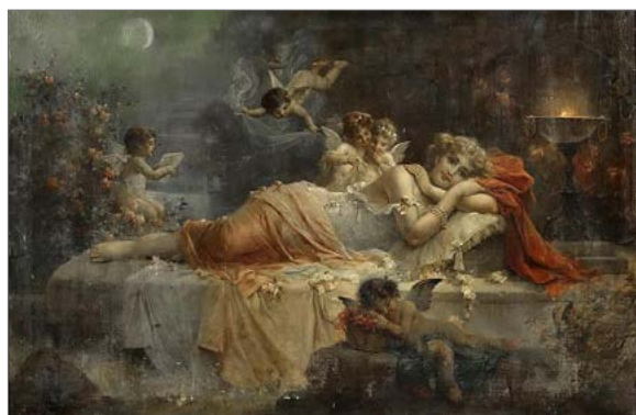
Hans Zatzka «Sweet dreams» Hans Zatzka «Magusad unistused» Ханс Зацка «Сладкие мечты»