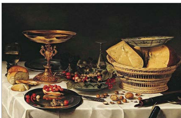
Pieter Claesz «Still life with cheese and fruit»